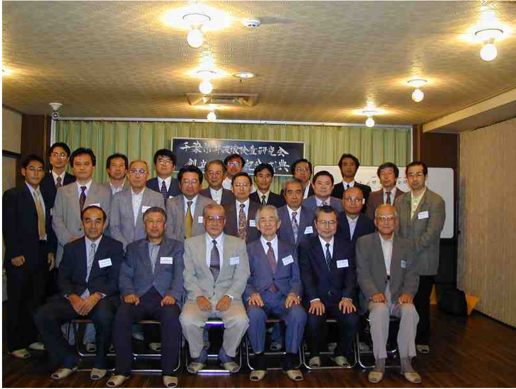
20周年記念式典 【平成13年(2001)9月29日 ホテル海光苑(鴨川市)】