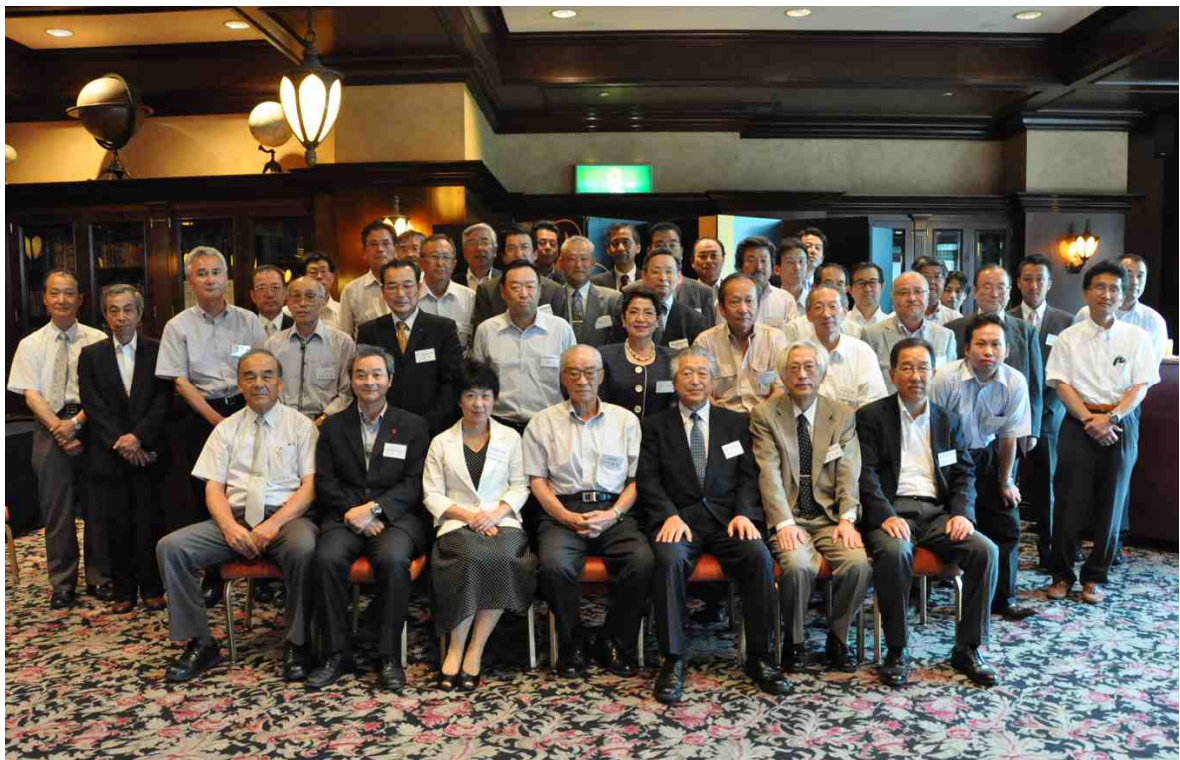
30周年記念式典 【平成23年(2011)7月8日 ホテルザ・マンハッタン】